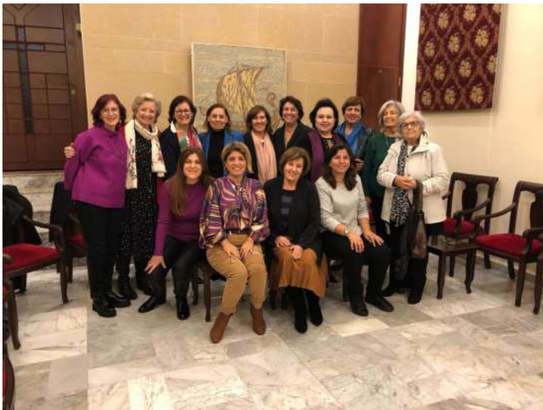
Jbeil - Maison paroissiale 25 novembre 2022