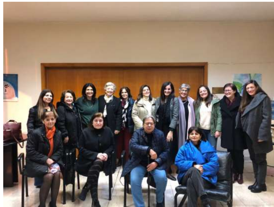
Campus du Liban Nord 12 janvier 2023