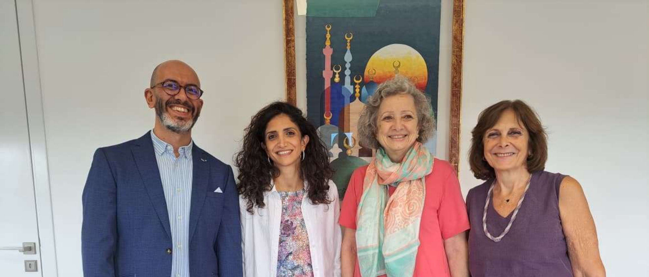
MoU avec la Fondation Adyan et le SWorld Research Hub – 18 septembre 2025